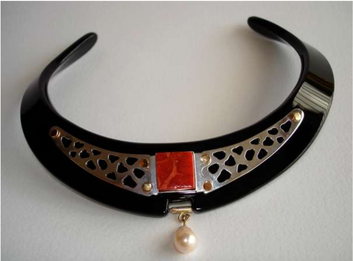
GIROCOLLO 1: Oro, Argento, Corallo Spugna, Perla e Plexiglass.