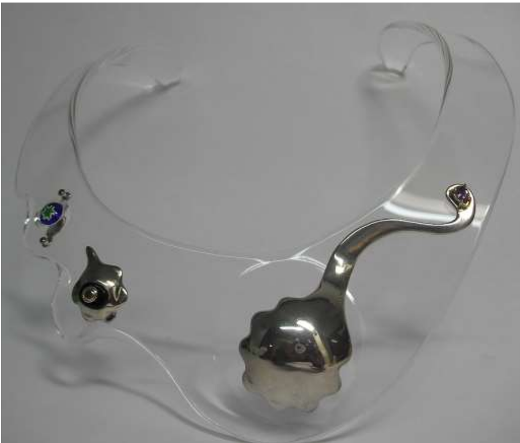
GIROCOLLO 2: Oro, Argento, Onice, Ametista, Murrina e Plexiglass.