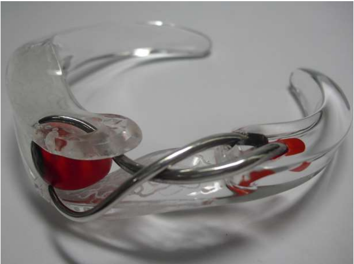
BRACCIALE 8: Argento, Seme di Peonia gigante, Pittura Acrilica e Plexiglass.