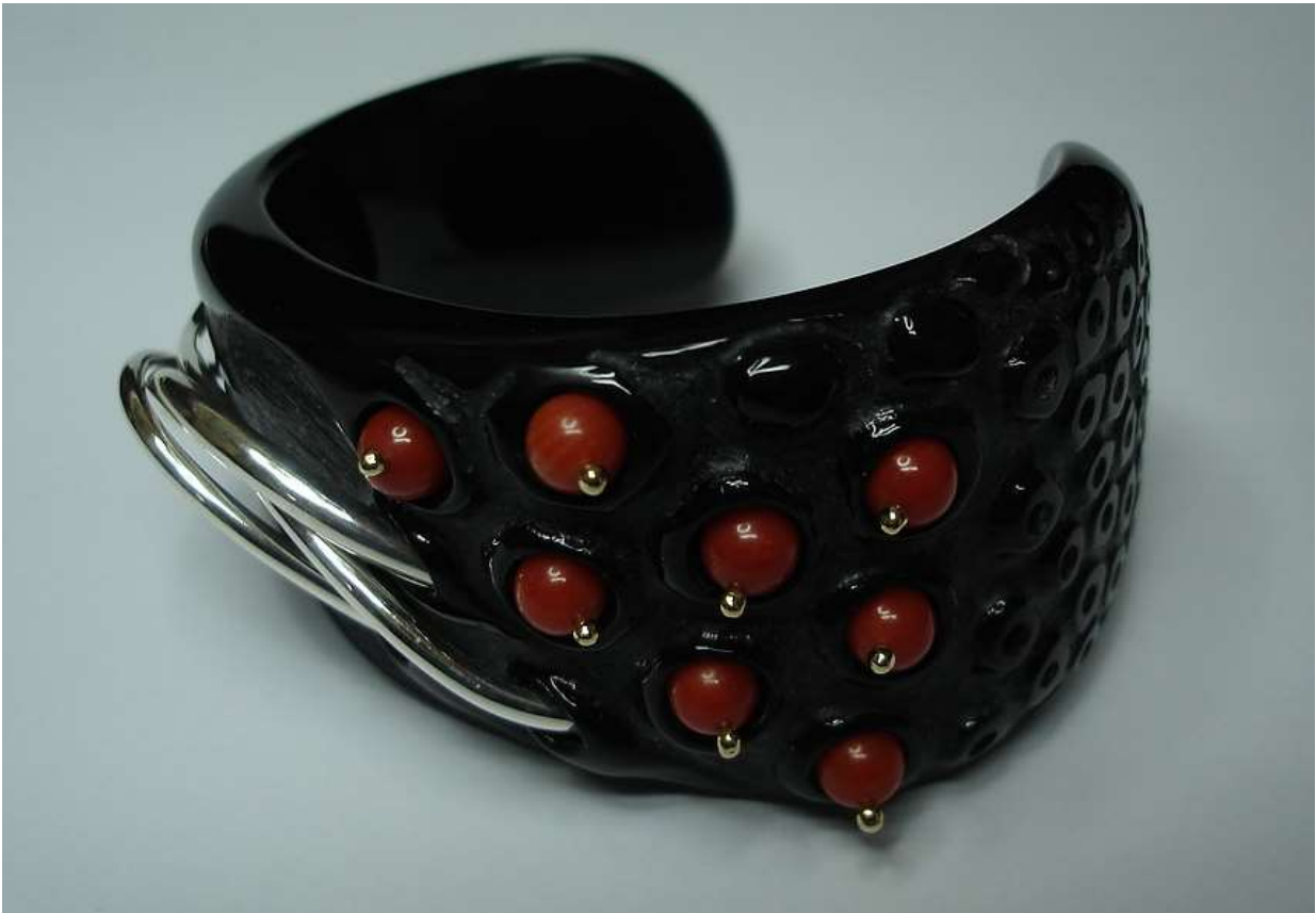
BRACCIALE 7: Oro, Argento, Corallo, Onice e Plexiglass.