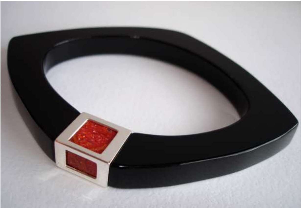
BRACCIALE 1: Argento, Corallo Spugna e Plexiglass.