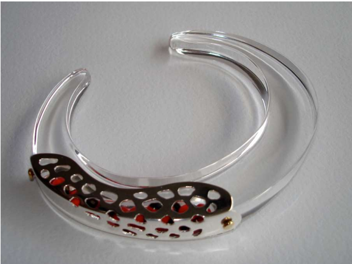
BRACCIALE 4: Oro, Argento, Seme di Peonia e Plexiglass.