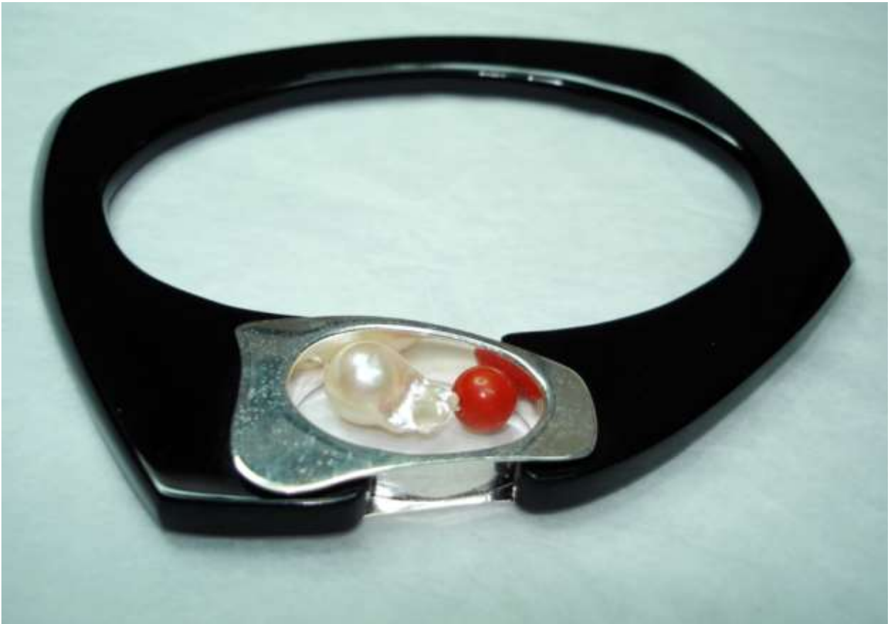
BRACCIALE 9: Argento, Perla, Corallo e Plexiglass.