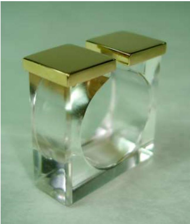
ANELLO 3: Oro e Plexiglass.