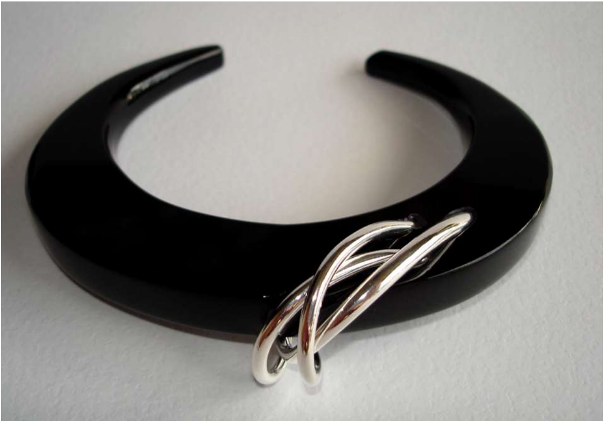
BRACCIALE 5: Argento e Plexiglass.