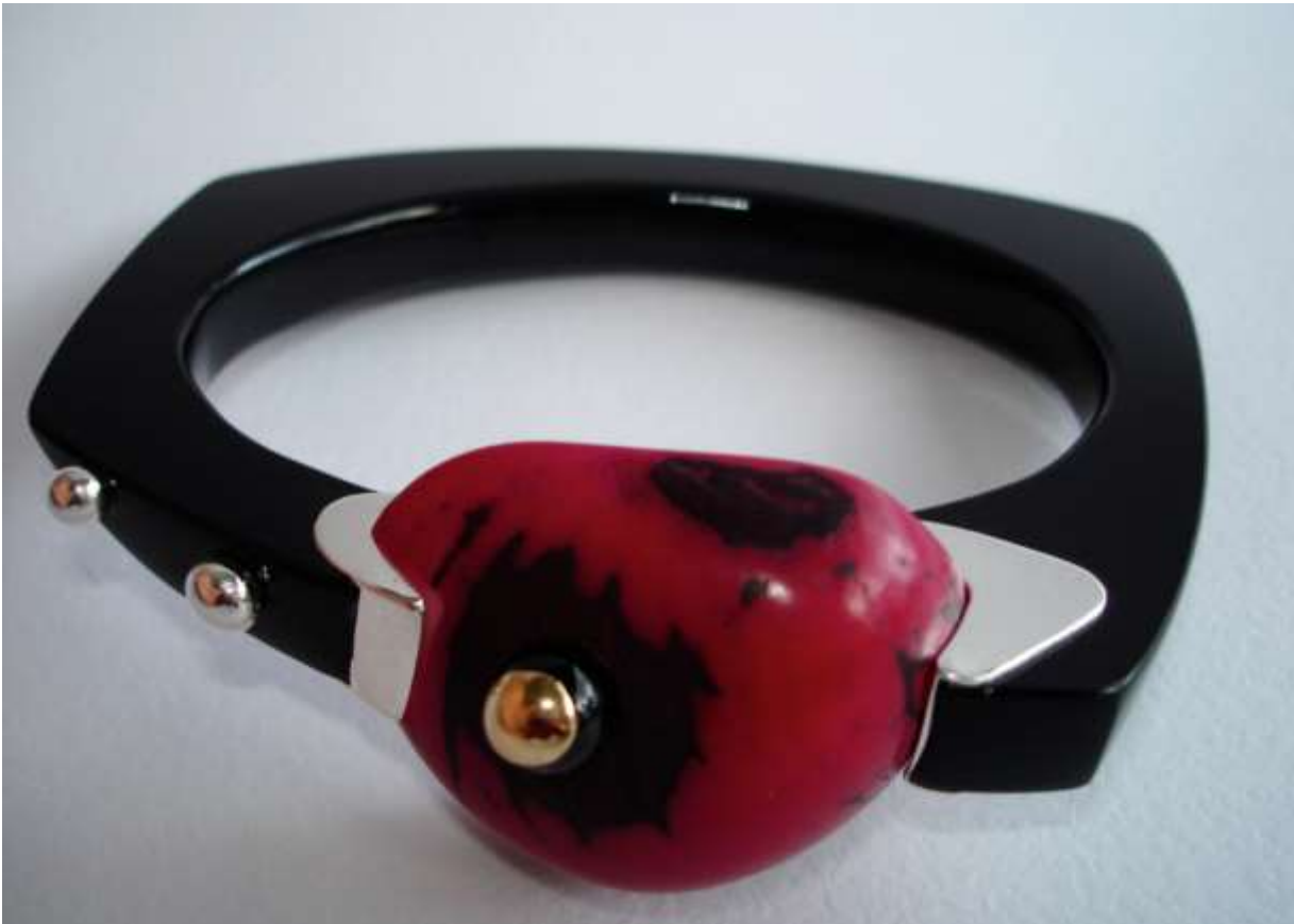
BRACCIALE 3: Oro, Argento, Tagua (Avorio Vegetale) Tinta e Plexiglass.