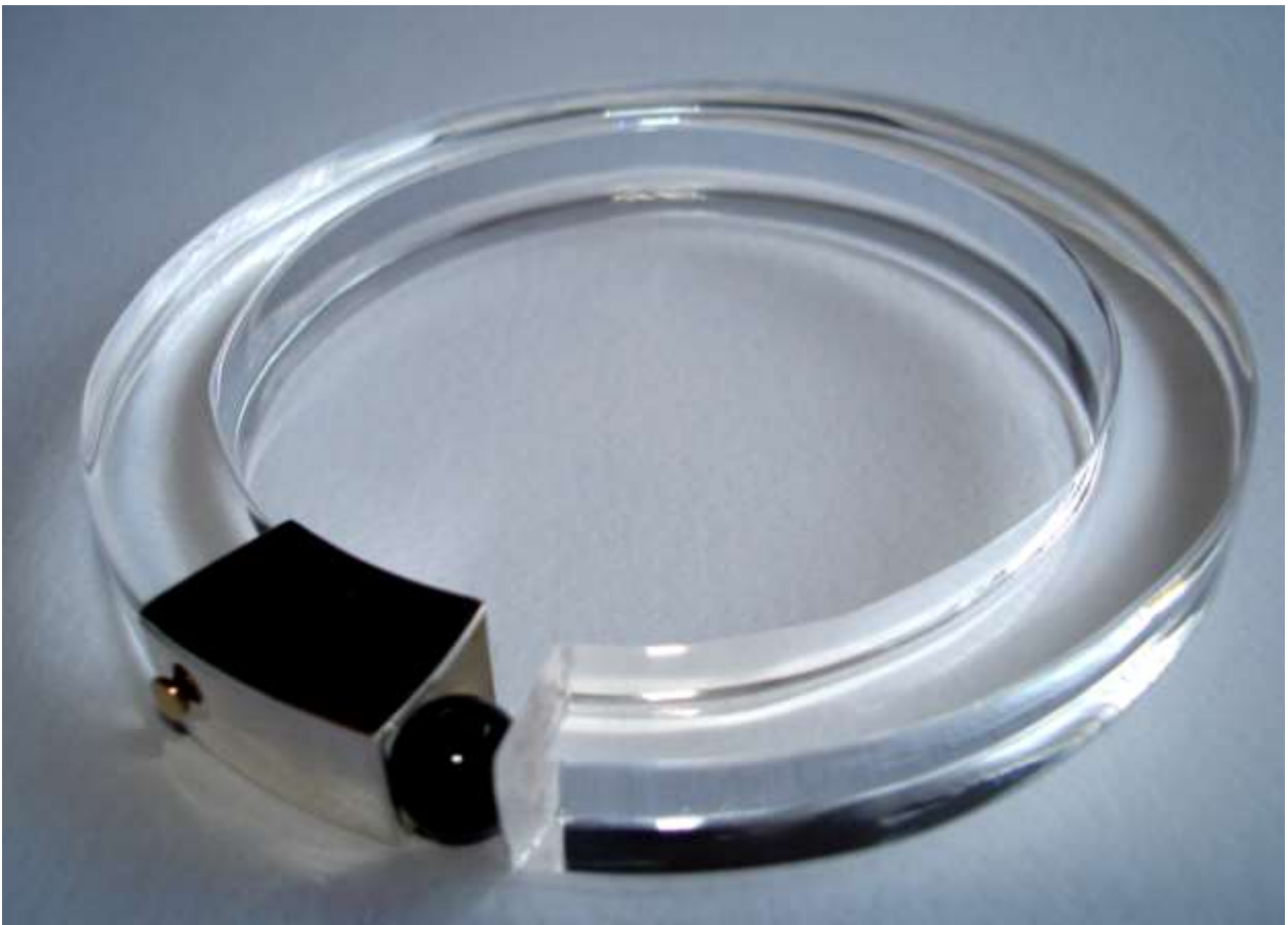
BRACCIALE 10: Oro, Argento, Onice e Plexiglass.