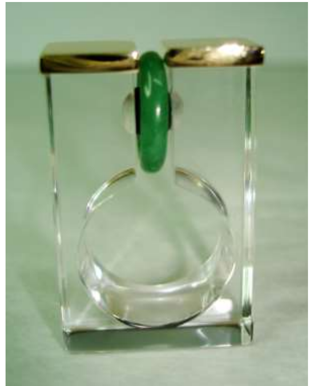
ANELLO 4: Oro, Giada, Onice e Plexiglass.