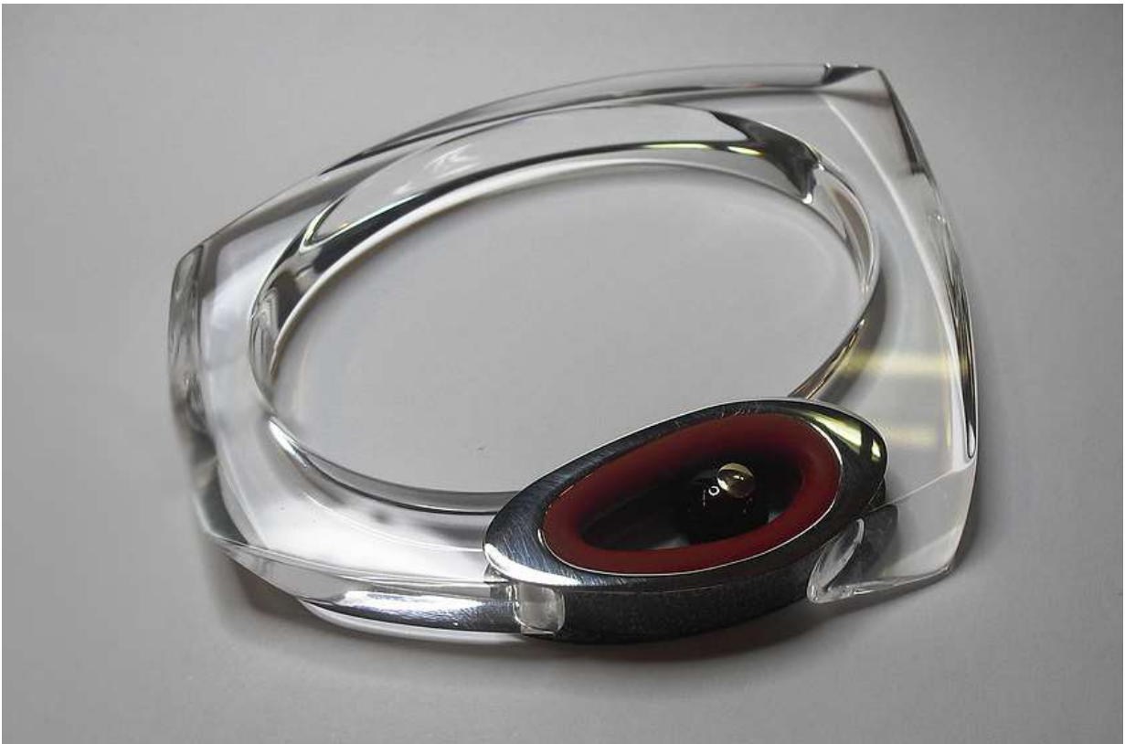
BRACCIALE 2: Oro, Argento, Onice, Anello di Gomma e Plexiglass.