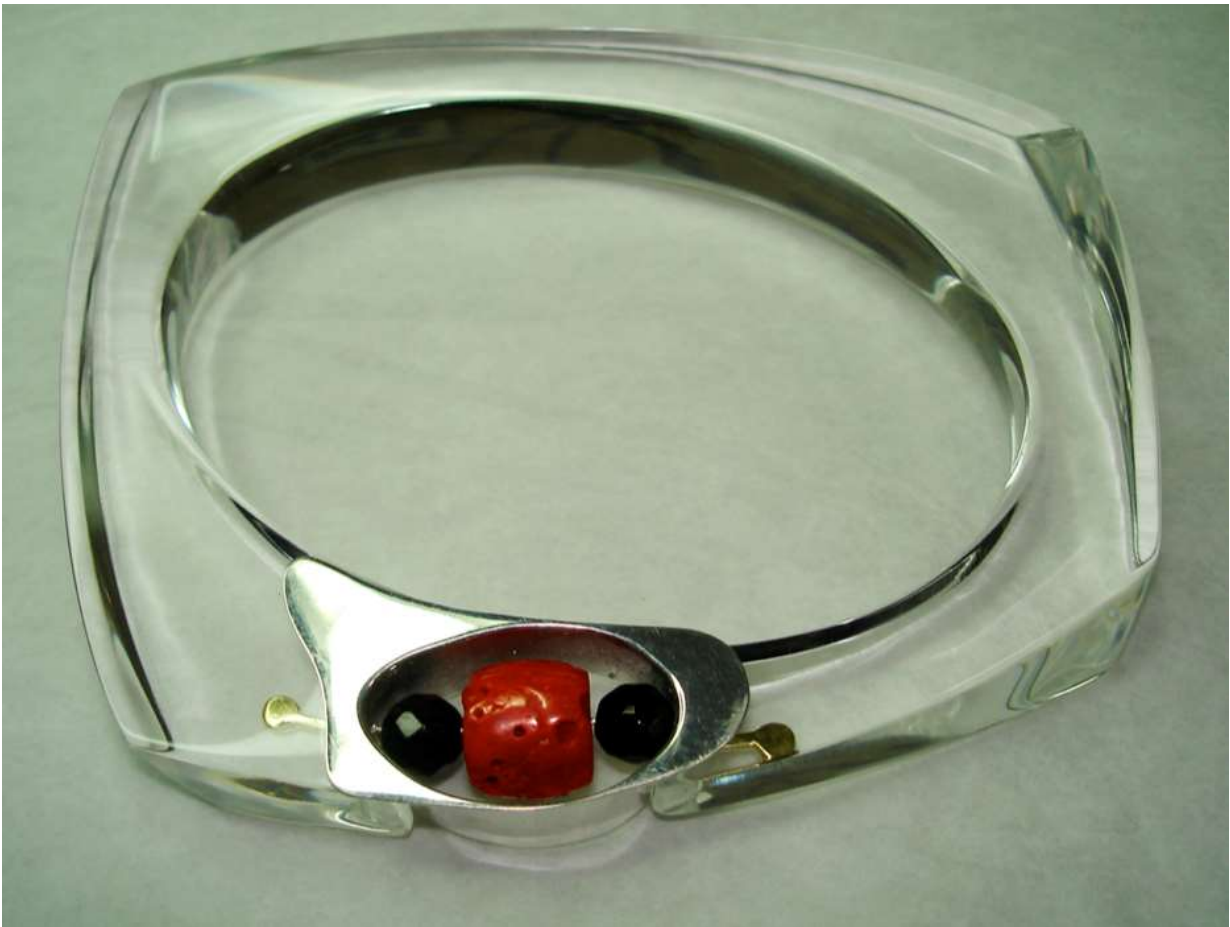
BRACCIALE 6: Oro, Argento, Corallo, Onice e Plexiglass.